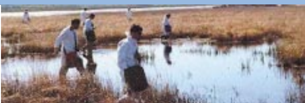
Application manuelle de formulation granulaire de Bacillus thuringiensis sur un site marécageux.