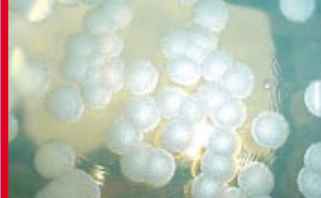
Isolation et cultivation des bactéries de Bacillus thuringiensis sur medium dans une boîte de Pétri.