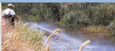
Application de formulation liquide de Bacillus thuringiensis par atomiseur.