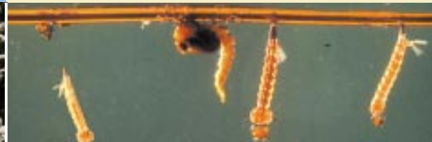
Stades larvaires dans l'eau et attachés à un brin.

Le Bt H-14 est d'une très grande efficacité sur les jeunes stades larvaires. Lorsque la proportion des larves âgées prédomine, il convient d'appliquer des doses plus élevées.